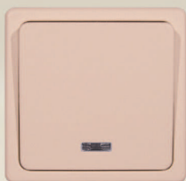
2 - krémová