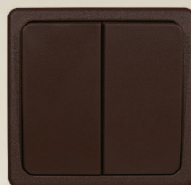
6 - tmavohnedá