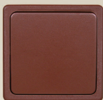
3 - škoricová