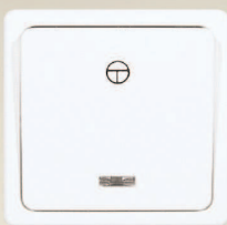
1 - biela